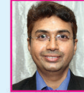
CA જીગર આર. ગોગરી (ડોણ) (સહ-માનદ્ મંત્રી)